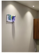
-실내기 설치 사진-

산소순도 75 ± 3% 산소유량 분당 12 ± 0.5리터 소비전력 480w ± 10% 크기 579X593X265(mm)